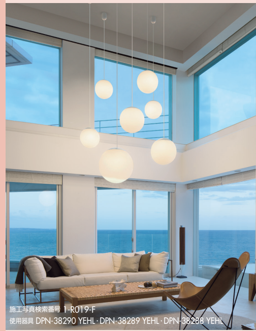
施工写真検索番号 1-R019-F 使用器具 DPN-38290 YEHL / DPN-38289 YEHL / DPN-38288 YEHL 吊り高さ…机上面より1,560(DPN-38290 YHL) / テーブルサイズW1,800×D800×H340