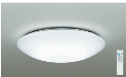
タイマー付リモコン・プルレス | 調色調光タイプ

傾斜天井 45° (別売) 取付パーツ DP-35345 HL 竿線天井可能 (別売) 取付パーツ DP-38415 HL