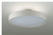
上面 調色6500K~2700K 調光5%~100%