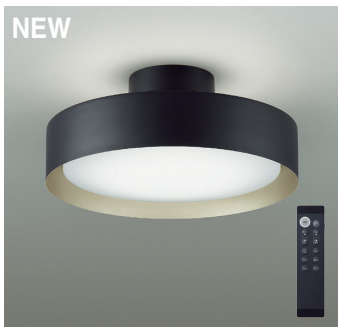
間接配光切替 | タイマー付リモコン付 | 調色調光タイプ