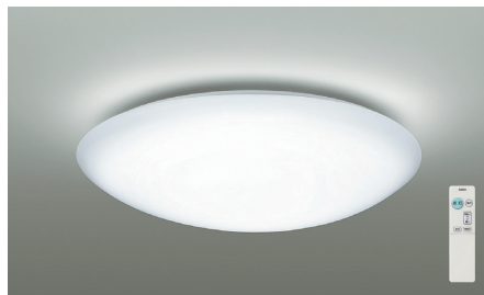
タイマー付リモコン・プルレス | 調光タイプ

傾斜天井 55° (別売) 取付パーツ DP-40091 HL 竿線天井可能 (別売) 取付パーツ DP-40638 HL