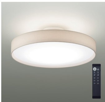
間接配光切替 | タイマー付リモコン付 | 調色調光タイプ