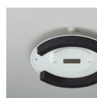
竿線天井用取付パーツ DP-38415 HL ¥4,800(税抜)