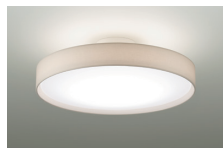
上面/下面 調色6500K~2700K 調光5%~100%