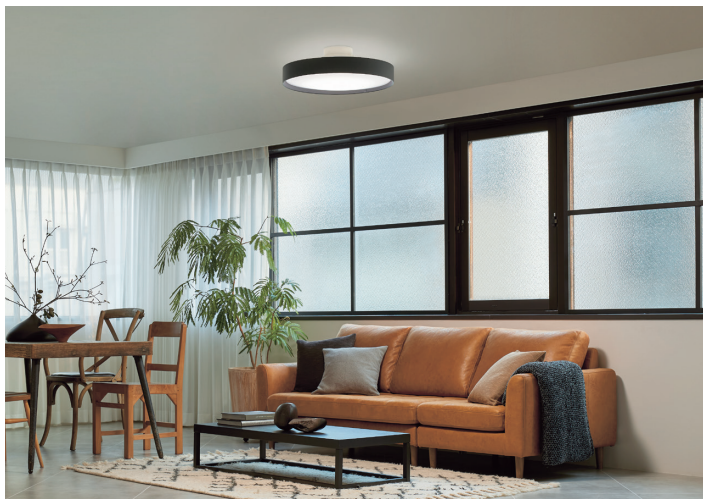
施工写真検索番号 1-Q017