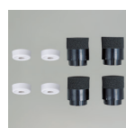
竿線天井用取付パーツ(各4個) DP-40638 HL ¥4,500(税抜)