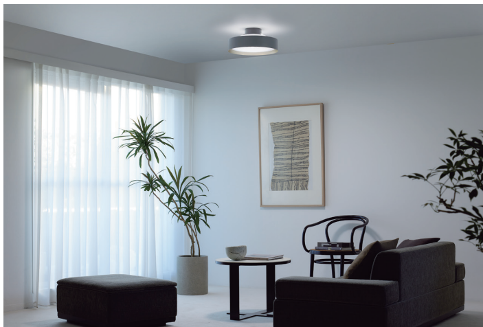
施工写真検索番号 1-M104