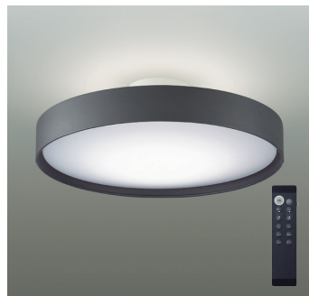
間接配光切替 | タイマー付リモコン付 | 調色調光タイプ