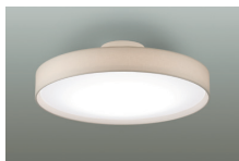
下面 調色6500K~2700K 調光5%~100%