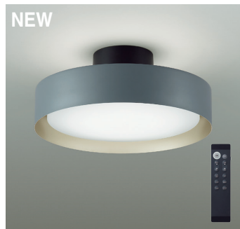
間接配光切替 | タイマー付リモコン付 | 調色調光タイプ