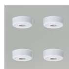
傾斜天井対応別売取付スペーサー(4個) DP-40091 HL ¥1,300(税抜)