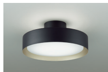
上面/下面 調色6500K~2700K 調光5%~100%