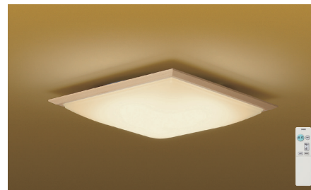
タイマー付リモコン・プルレス | 調光タイプ

傾斜天井 55° (別売) 取付パーツ DP-40091 HL 竿線天井可能 (別売) 取付パーツ DP-40638 HL