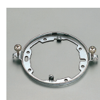
傾斜天井対応取付金具 DP-35345 HL ¥800(税抜)