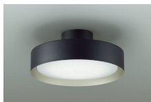
下面 調色6500K~2700K 調光5%~100%