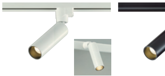
ガラスレス | プラグタイプ